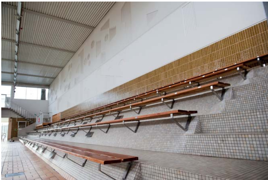
Bassänghallen, sittplatser, kakelmosaik