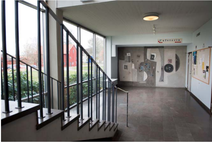
Entréhall med Ingemar Lööfs utsmyckning av östra väggen