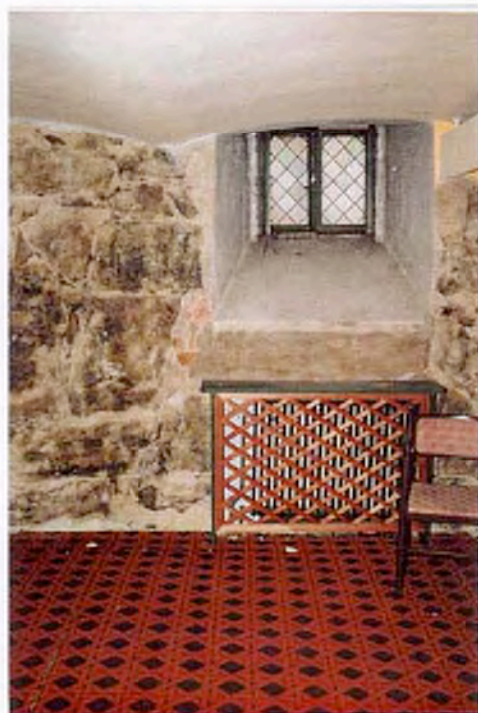
Källaren, fönster mot torget. Brandsäkert bjälklag från 1879.

Sammantaget sett har byggnaden ett mycket stort kulturhistoriskt värde. Den är av omistligt värde för stadsbilden. Den går helt enkelt inte att ersätta. Även invändigt har byggnaden stora kulturhistoriska värden, det gäller i synnerhet stora salen som också måste betraktas som omistlig i sammanhanget. Byggnaden är genom sina material och konstruktionsmetoder också en mycket tydlig illustration av det sena 1800-talets moderna byggnadsteknik.