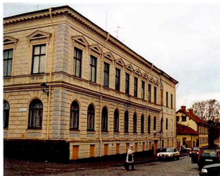
Fasad mot Kyrkogatan.

Formmässigt har tillbyggnaden från 1929 mycket väl anpassats till den äldre delen.