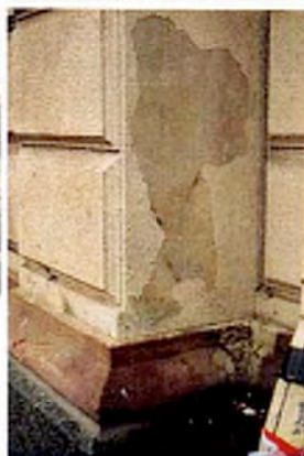
Detalj av sockel och puts. Under plastfärgen finns ursprunglig kalkfärg.