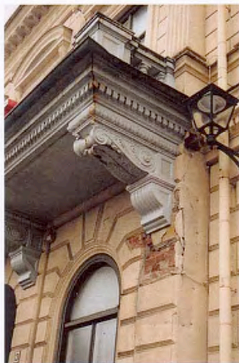
Detalj av balkong. Frostsprängningar i putsen.