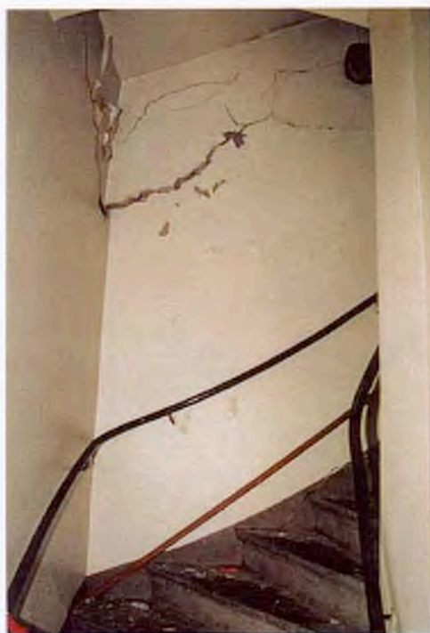
Kökstrappan vid anslutningen mot tillbyggnaden. Sprickor i mur.