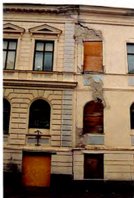
Den kraftigaste sprickan finns i skarven mellan tillbyggnaden och den ursprungliga byggnaden.

Stadshotellet har genom åren genomgått åtskilliga invändiga ombyggnader. Särskilt stora är de invändiga förändringarna i den del som på senare år använts som restaurang och diskotek. Där har stora håltagningar i murverk gjorts för att få ett mer öppet rumssamband. Vid en närmare genomgång av huset upptäcker man dock att en hel del av den ursprungliga inredningen och planlösningen ändå finns kvar.