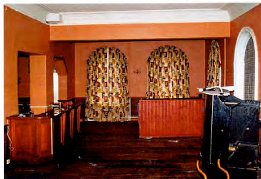
F.d. cafélokalen. Fönster med smygpanel, putsad, profilerad taklist.

Flygeln mot Kyrkogatan har mittkorridor omgiven av resanderum som till stor del präglas av en modernisering omkring 1940. Ursprungliga detaljer i form av fönsterfoder finns dock kvar. I hörnrummet med fönster mot både torget och Kyrkogatan finns dessutom smygpanel och