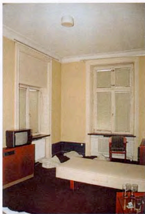
Hörnrum mot torget och Kyrkogatan. Del av en större f.d. 2-rumssvit med påkostad inredning.